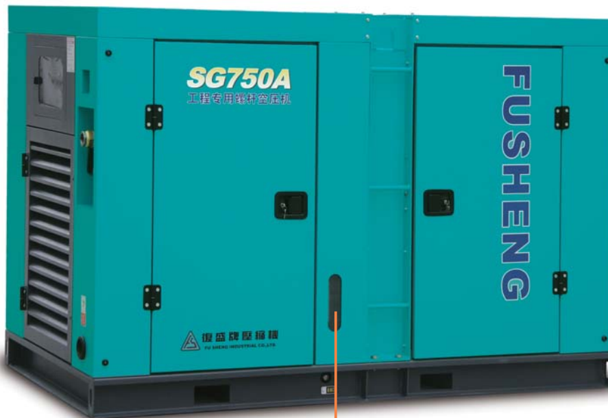
方便的观油窗设计